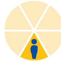
١ من ٦

المصابين بمرض السل النشط يذهبون الى المستشفى