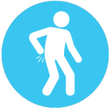
ឈឺសាច់ដុំ