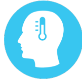
គ្រុនក្តៅ & ឈឺក្បាល

សញ្ញាដំបូងៗអាចមានដូចជា គ្រុនក្តៅ ភាពល្អិតល្អៃ (ពិបាកក្នុងខ្លួន) ឈឺក្បាល ហើមកូនកណ្តុរ និងពេលខ្លះក្អក ឬឈឺបំពង់កផងដែរ។ រោគសញ្ញាផ្សេងទៀតមានដូចជា ឈឺសាច់ដុំ ចុកខ្ទង គ្រុនរងា និងអស់កម្លាំង ហើយបន្ទាប់មកមានឡើងកន្ទួលរមាស់ ដែលជាធម្មតាចាប់ផ្តើមចេញនៅលើមុខ ហើយរាលដាលដល់ផ្នែកផ្សេងទៀតនៅលើដងខ្លួន។ ជំងឺនេះអាចនឹងបាក់ទៅវិញក្នុងរយៈពេលពី ពីរទៅបួន សប្តាហ៍។ ហើយមនុស្សមួយចំនួនគ្រាន់តែមានឡើងកន្ទួលរមាស់ ព្រមទាំងពេលខ្លះមានហើមកូនកណ្តុរ និងពេលខ្លះមិនមានដែលកន្ទួលរមាស់នេះអាចនឹងចេញនៅលើប្រដាប់ភេទផងដែរ។