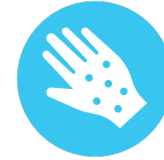
Ցան, Բշտիկներ Կամ Ուռուցքանման Գոյացություններ