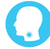
Ավշային Հանգույցների Այտույց