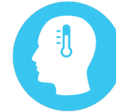
Ջերմություն և Գլխացավը

Վաղ նշանները կարող են ներառել ջերմություն, թուլություն (ընդհանուր անհանգստություն), գլխացավ, ավշային հանգույցների այտուց և երբեմն հազ կամ կոկորդի ցավ: Այլ ախտանիշները ներառում են մկանային ցավեր, մեջքի ցավ, դող և սաստիկ հոգնածություն, որին հաջորդում է ցանը, որը սովորաբար առաջանում է դեմքին և տարածվում մարմնի այլ մասեր: Վարակները կարող են տևել երկուսից չորս շաբաթ: Իսկ որոշ մարդկանց մոտ առաջանում է ցան՝ ավշային հանգույցների այտուցմամբ կամ առանց դրա, որը կարող է լինել սեռական օրգանների շրջանում: