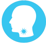
تضخم العقد الليمفاوية