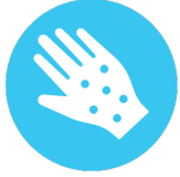
الطفح الجلدي أو التنوءات أو البثور